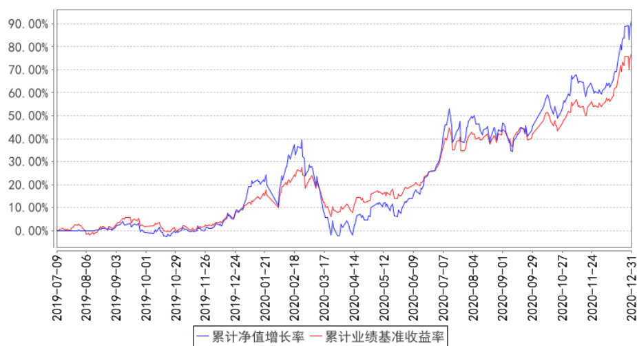
浦银安盛环保新能源C类累计净值增长率与同期业绩比较基准收益率的历史走势对比图